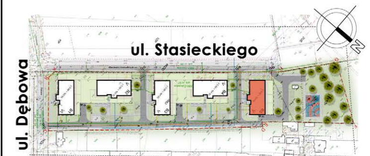
BUDYNEK NR 5

tel. 48 384 65 10 e-mail: sprzedaz@rtbs.eu ul. Waryńskiego 16A, 26-600 Radom