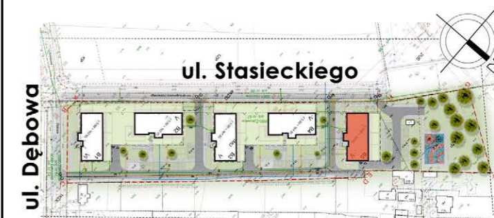
BUDYNEK NR 5

tel. 48 384 65 10 e-mail: sprzedaz@rtbs.eu ul. Waryńskiego 16A, 26-600 Radom