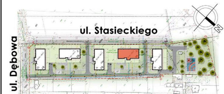
BUDYNEK NR 4

tel. 48 384 65 10 e-mail: sprzedaz@rtbs.eu ul. Waryńskiego 16A, 26-600 Radom