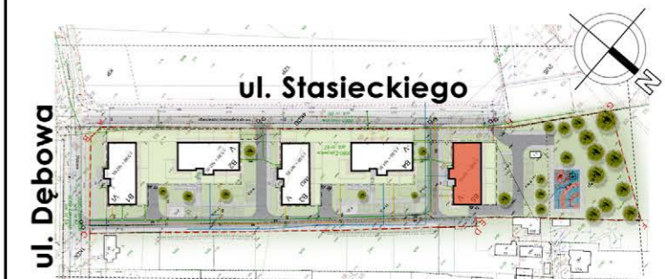
BUDYNEK NR 5

tel. 48 384 65 10 e-mail: sprzedaz@rtbs.eu ul. Waryńskiego 16A, 26-600 Radom