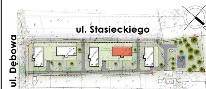
BUDYNEK NR 4

tel. 48 384 65 10 e-mail: sprzedaz@rtbs.eu ul. Waryńskiego 16A, 26-600 Radom