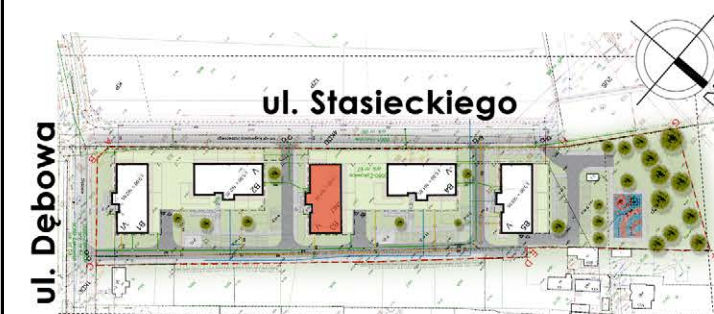
BUDYNEK NR 3

tel. 48 384 65 10 e-mail: sprzedaz@rtbs.eu ul. Waryńskiego 16A, 26-600 Radom