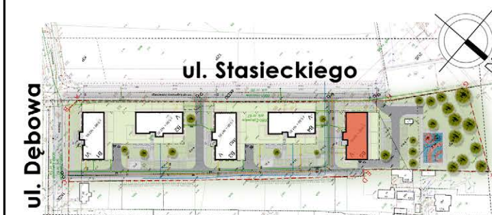
BUDYNEK NR 5

tel. 48 384 65 10 e-mail: sprzedaz@rtbs.eu ul. Waryńskiego 16A, 26-600 Radom